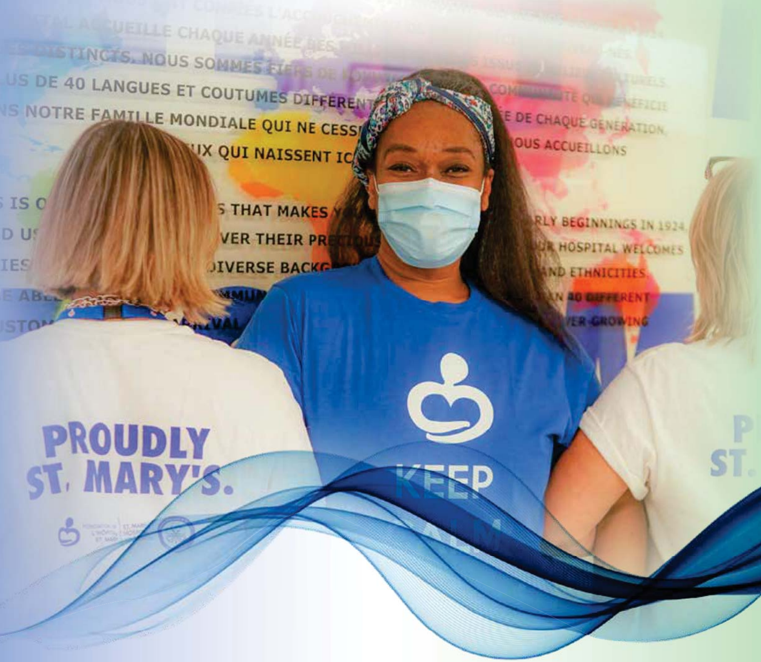
FIÈREMENT ST. MARY. | PROUDLY ST. MARY'S. (de gauche à droite / from left to right):